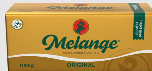
Melange 12 x 1 kg EPD nr: 4 670 253