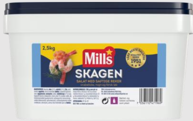
Mills Skagen 2,5 kg EPD nr: 6 324 479