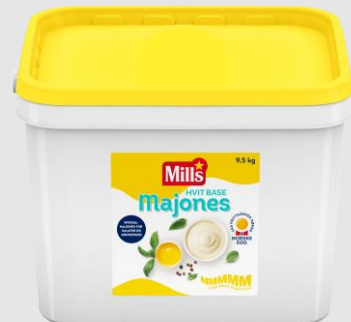
Mills Hvit Basemajones 9,5 kg EPD nr: 6 191 787