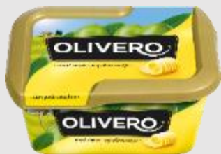
Olivero beger 18 x 400 g EPD nr: 4 683 678