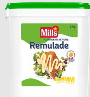
Mills Kj. Sjefens Remulade 5 kg EPD nr: 2 796 399