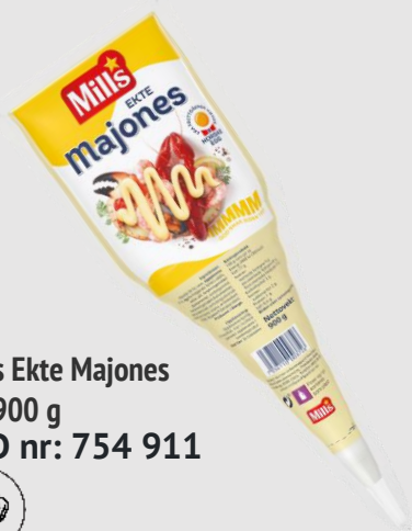
Mills Ekte Majones 5 x 900 g EPD nr: 754 911