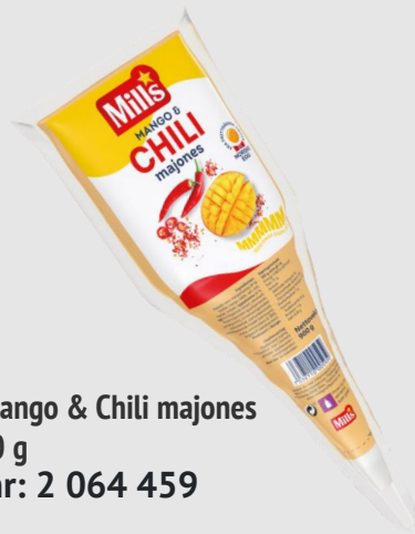
Mills Mango & Chili majones 5 x 900 g EPD nr: 2 064 459