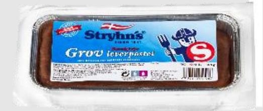
Stryhn's Grov postei 3 x 500g EPD nr: 5 892 005