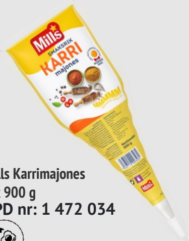
Mills Karrimajones 5 x 900 g EPD nr: 1 472 034