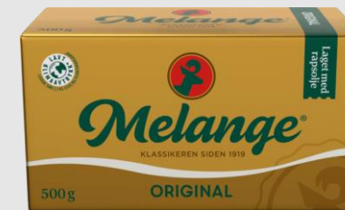
Melange 18 x 500 g EPD nr: 4 670 238