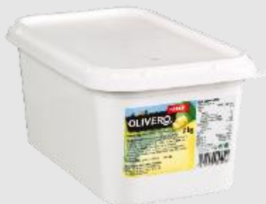
Olivero boks 2 x 2 kg EPD nr: 4 825 048