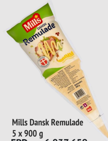
Mills Dansk Remulade 5 x 900 g EPD nr: 6 037 659