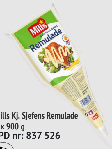
Mills Kj. Sjefens Remulade 5 x 900 g EPD nr: 837 526