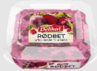
Mills Rødbetsalat 8 x 200 g EPD nr: 6 323 109