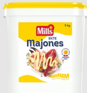
Mills Ekte Majones 5 kg EPD nr: 2 793 610