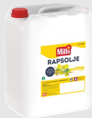
Mills Rapsolje 10 L EPD nr: 1 468 347