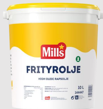
Mills fritureolie 10 L EPD nr: 2 793 826