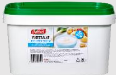
Delikat Potetsalat Creme Fraiche 2,5 kg EPD nr: 2 990 430