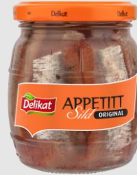
Delikat Appetittsild 8 x 270g EPD nr: 6 142 871