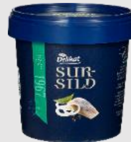
Delikat Sursild 2 x 1300 g EPD nr: 5 542 410