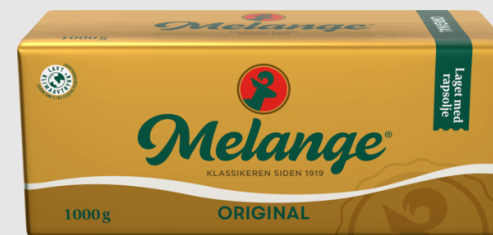
Melange 12 x 1 kg EPD nr: 4 670 253