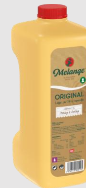
Flytende Melange 4 x 2 L EPD nr: 885 616