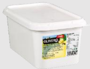
Olivero boks 2 x 2 kg EPD nr: 4 825 048