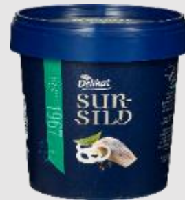
Delikat Sursild 2 x 1300 g EPD nr: 5 542 410