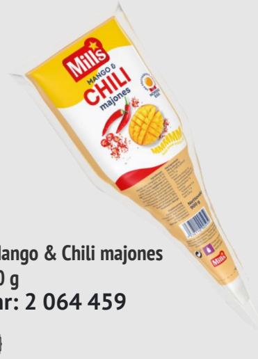
Mills Mango & Chili majones 5 x 900 g EPD nr: 2 064 459