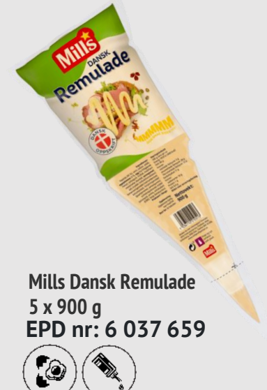
Mills Dansk Remulade 5 x 900 g EPD nr: 6 037 659