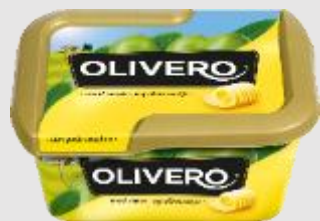
Olivero beger 18 x 400 g EPD nr: 4 683 678