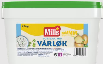
Mills Vårløk Potet CF 2,5kg EPD nr: 6 558 548