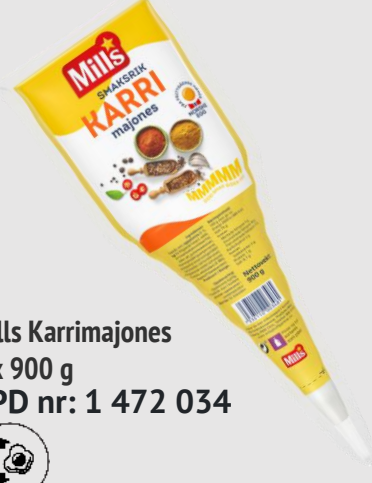
Mills Karrimajones 5 x 900 g EPD nr: 1 472 034