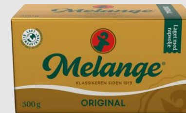
Melange 18 x 500 g EPD nr: 4 670 238