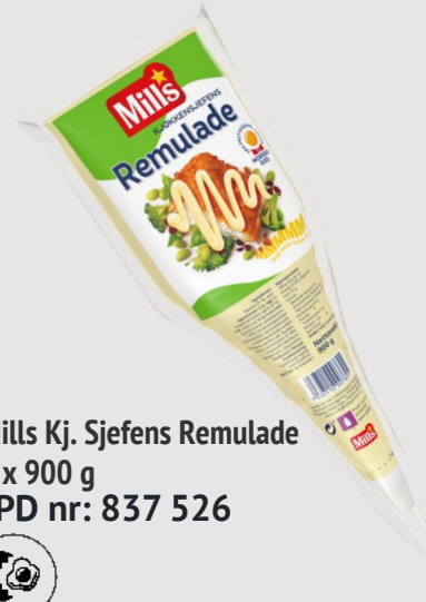
Mills Kj. Sjefens Remulade 5 x 900 g EPD nr: 837 526