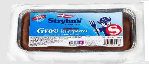
Stryhn's Grov postei 3 x 500g EPD nr: 5 892 005