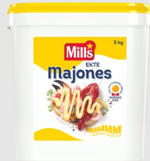
Mills Ekte Majones 5 kg EPD nr: 2 793 610