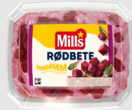
Mills Rødbetsalat 8 x 200 g EPD nr: 6 323 109