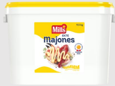
Mills Ekte Majones 9,5 kg EPD nr: 2 793 438