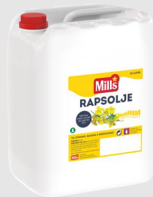
Mills Rapsolje 10 L EPD nr: 1 468 347