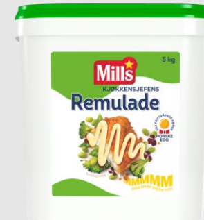
Mills Kj. Sjefens Remulade 5 kg EPD nr: 2 796 399