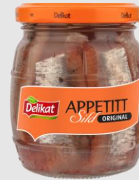
Delikat Appetittsild 8 x 270g EPD nr: 6 142 871