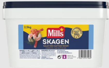
Mills Skagen 2,5 kg EPD nr: 6 324 479