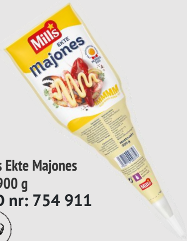
Mills Ekte Majones 5 x 900 g EPD nr: 754 911