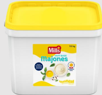
Mills Hvit Basemajones 9,5 kg EPD nr: 6 191 787